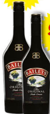
Crema Whisky Baileys 1 L.