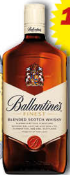
Whisky Ballantine's 1 L.