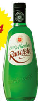
Ruavieja Orujo Hierbas 70 cl.