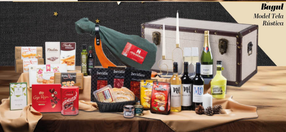
Bagul Model Tela Rústica