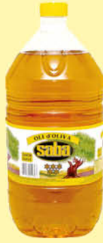
Tavola Oli Oliva Gust Suau 5 L.