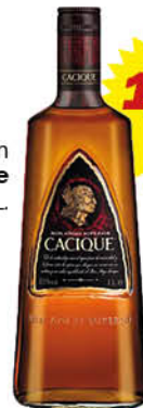
Rom Cacique 1 L.