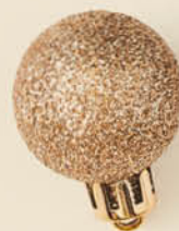
Cistella 15 60,05 € + IVA