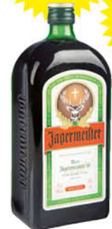
Licor Jagermeister 70 cl. C6